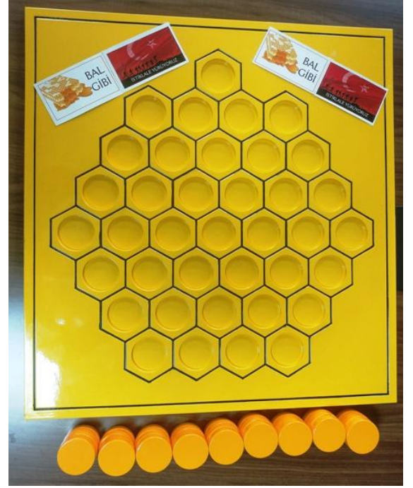
Resim 2. İstiklal Marşı Kelime Bilgisi Oyun Tahtası 2

Resim 3 ve Resim 4’de görüldüğü gibi dairelerin iç tarafında istiklal marşı kelimelerini yazdık.