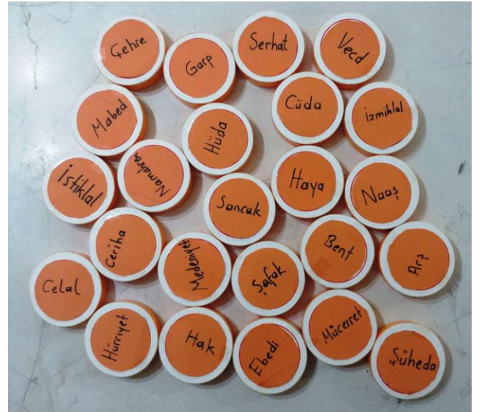
Resim 4. İstiklal Marşı Bilinmeyen Kelimeler

İstiklal marşı hakkında daha fazla bilgi sahibi olunması için sorular ekledik. Sorular Resim 5’de görüldüğü gibidir.