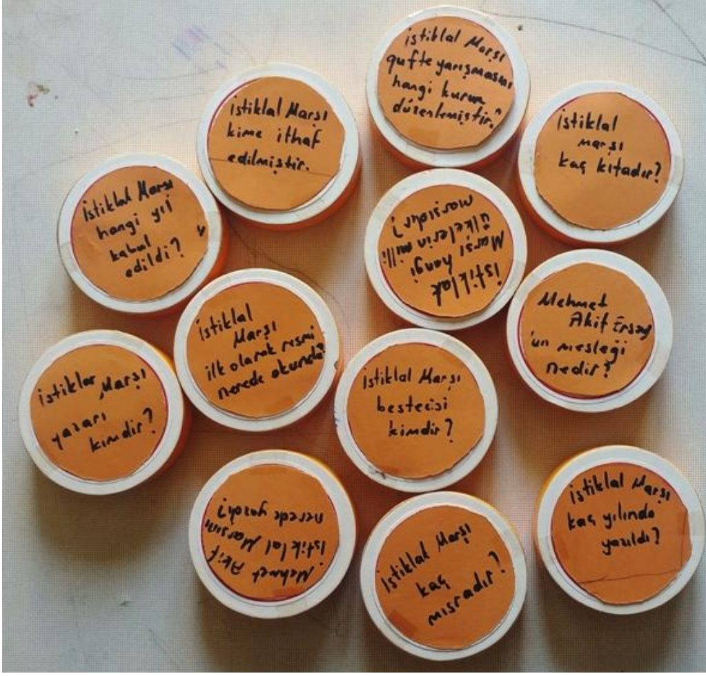
Resim 5. İstiklal Marşı Bilgi Soruları

Oyun kurallarını Tablo 9'daki gibi belirledik.