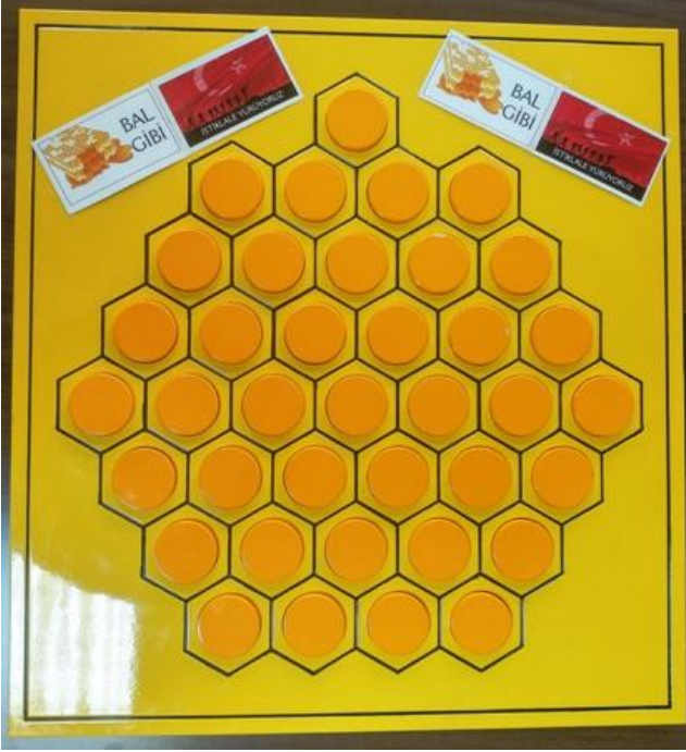
Resim 1. İstiklal Marşı Kelime Bilgisi Oyun Tahtası 1

İstiklal Marşı kelimelerinin tüm arkadaşlarımızın öğrenmesi için “Bal Gibi İstiklale Yürüyoruz” oyununu geliştirdik. Bu oyun Resim 1 ve Resim 2’de görülmektedir. Her bir peteğin içinde daire tahta vardır.