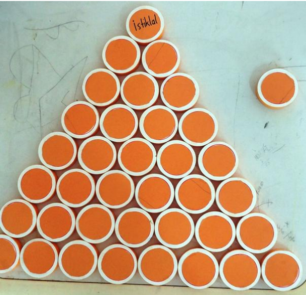
Resim 3. İstiklal Marşı Kelime Daireleri

Resim 3 ve Resim 4’de görüldüğü gibi dairelerin iç tarafında istiklal marşı kelimelerini yazdık.