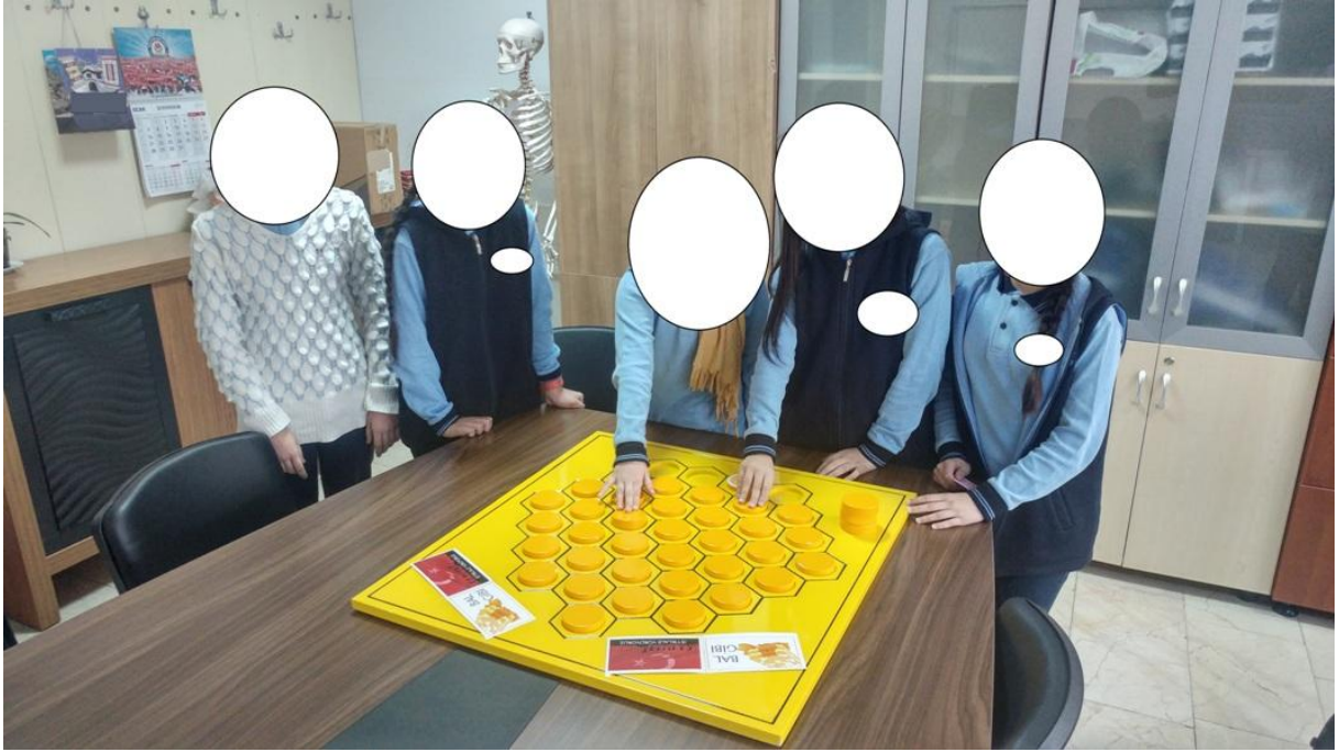
Resim 7. “Bal Gibi İstiklale Yürüyorum” Oyununu Oynanması 2

Arkadaşlarımız oyunu, oyun tahtasını çok beğendi. Eğlenerek yarıştılar. İstiklal Marşı hakkında ne kadar bilmedikleri bilgiler olduğunu kavradılar. Çalışma ile hem İstiklal Marşı gibi çok önemli bir konu hakkında bilgiler elde ettik. Bunun yanında bir oyun tasarlamış olduk.